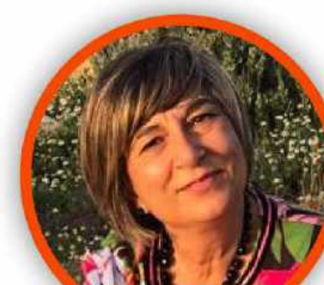
GIOVANNA MARIA BURRELLI SCUOLA PRIMARIA